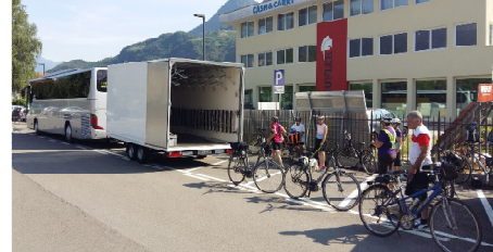
ReiseCar mit Biketrailer für 40 Velos