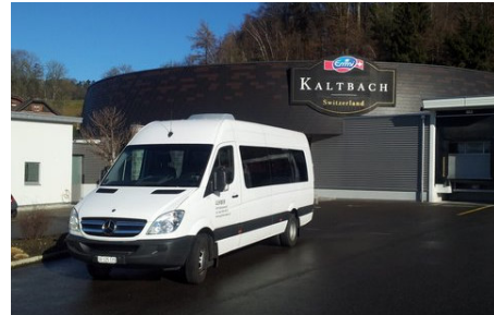
Midibus 21 Pl. & Mietbus 15 Pl.