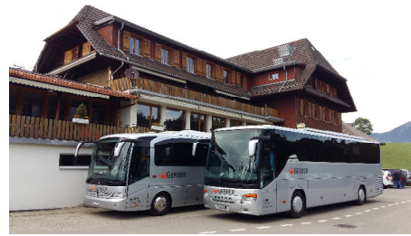
ReiseCar 33 Pl. & 50 Pl.