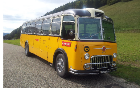
Oldtimer Postauto FBW, 36 Pl.